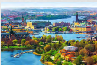
Programa de Innovación