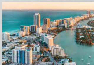
Programa de Emprendimiento

Sólo incluye el programa formativo y además es optativa la asistencia (pero no disminuye el precio). Si quisieran asistir a más de una expedición tendría un costo adicional de 1.900€ cada una.