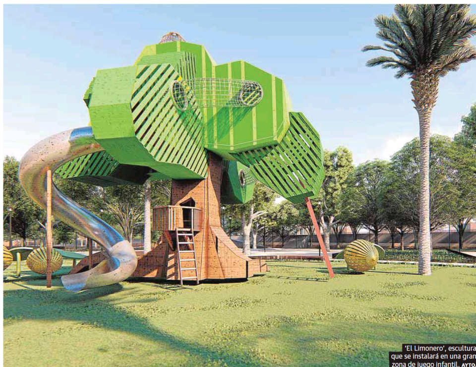
‘El Limonero’, escultura que se instalará en una gran zona de juego infantil. AVT0.

Venta conjunta e inseparable con AS en la Región de Murcia Precio de referencia de LA VERDAD: 1,05€