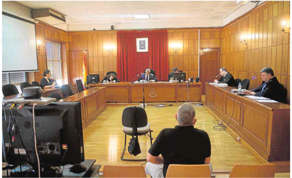
Celebración de un juicio en una de las salas de la Audiencia Provincial de Murcia.

El colapso, sin embargo, no afecta por igual a todas las jurisdicciones. «Ahora mismo hay un miedo brutal a qué va a pasar con la jurisdicción mercantil cuando se abra de nuevo el tema de los concursos», reconoce el decano de los letrados murcianos. «Si las previsiones se cumplen, habrá una cantidad enorme de concursos con el cierre de empresas». Incide también en los problemas que ya se están dando en los órganos de lo Social. «Y en Familia los retrasos